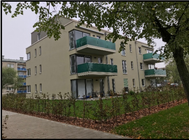
Sielower Straße 23+26