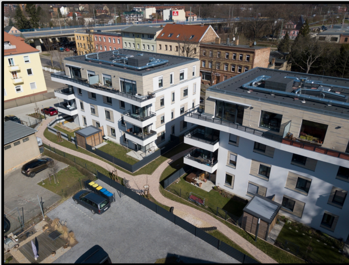
Bautzener Straße 138-139