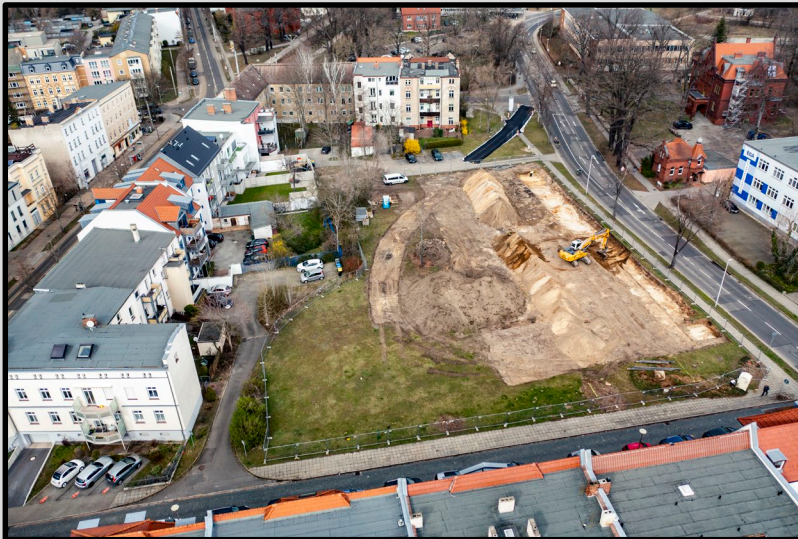
Quartiers-Randbebauung mit Tiefgarage

Wohnungen: 53 Wohnfläche: 4.241 m 2 Fertigstellung: Mitte 2023